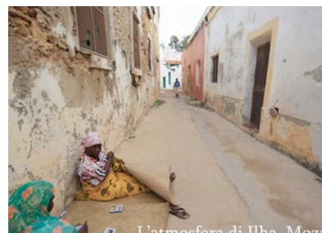
L'atmosfera di Ilha Moçambique

Contattaci all'indirizzo info@afriawildtruck.com per prenotare on line il tuo posto sul truck o per qualsiasi altra informazione.